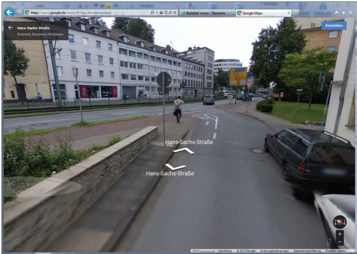
Abbildung 1 Google Maps